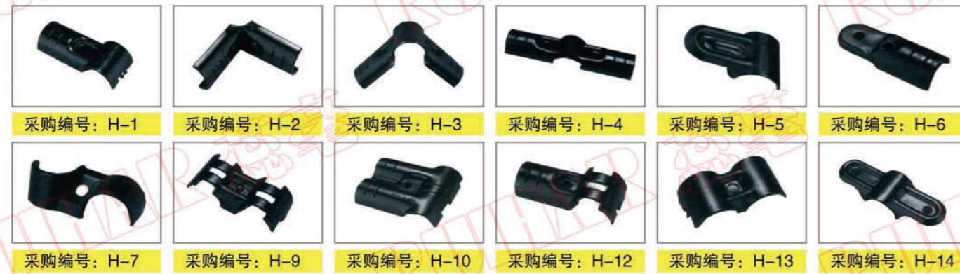
采购编号: H-1 采购编号: H-2 采购编号: H-3 采购编号: H-4 采购编号: H-5 采购编号: H-6 采购编号: H-7 采购编号: H-9 采购编号: H-10 采购编号: H-12 采购编号: H-13 采购编号: H-14