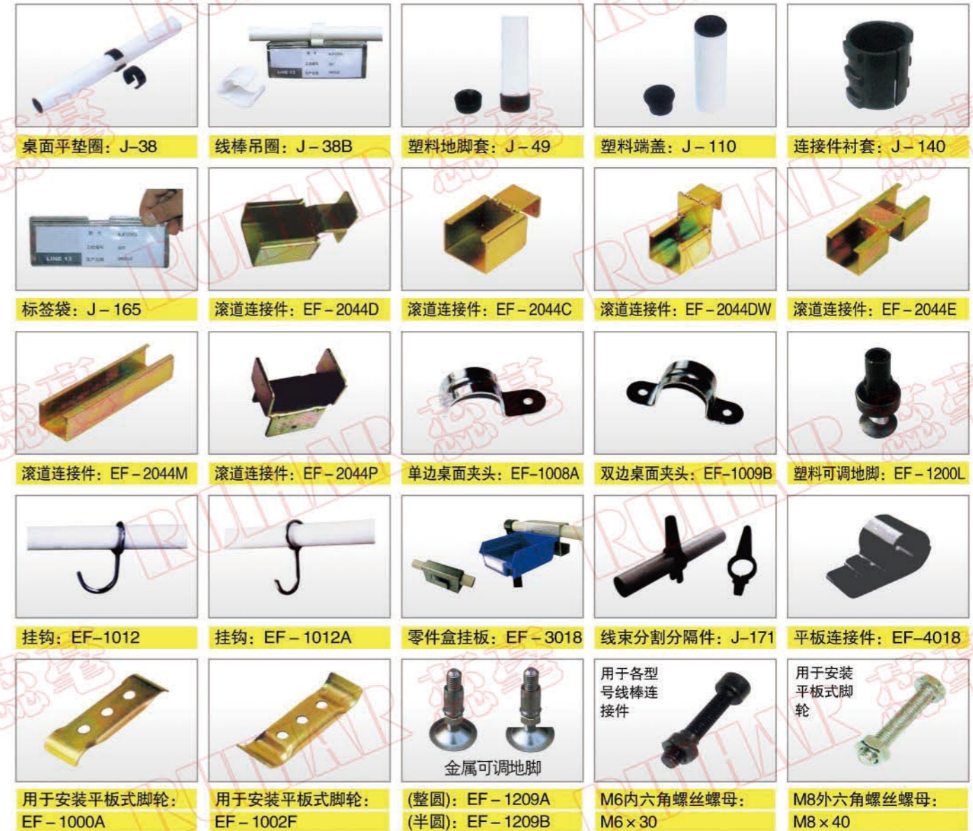
桌面平垫圈: J-38 线棒吊圈: J-38B 塑料地脚套: J-49 塑料端盖: J-110 连接件衬套: J-140 标签袋: J-165 滚道连接件: EF-2044D 滚道连接件: EF-2044C 滚道连接件: EF-2044DW 滚道连接件: EF-2044E 滚道连接件: EF-2044M 滚道连接件: EF-2044P 单边桌面夹头: EF-1008A 双边桌面夹头: EF-1009B 塑料可调地脚: EF-1200L 挂钩: EF-1012 挂钩: EF-1012A 零件盒挂板: EF-3018 线束分割分隔件: J-171 平板连接件: EF-4018 用于安装平板式脚轮: EF-1000A 用于安装平板式脚轮: EF-1002F 金属可调地脚: (整圆): EF-1209A, (半圆): EF-1209B 用于各型号线棒连接件: M6内六角螺丝螺母: M6×30, M8外六角螺丝螺母: M8×40