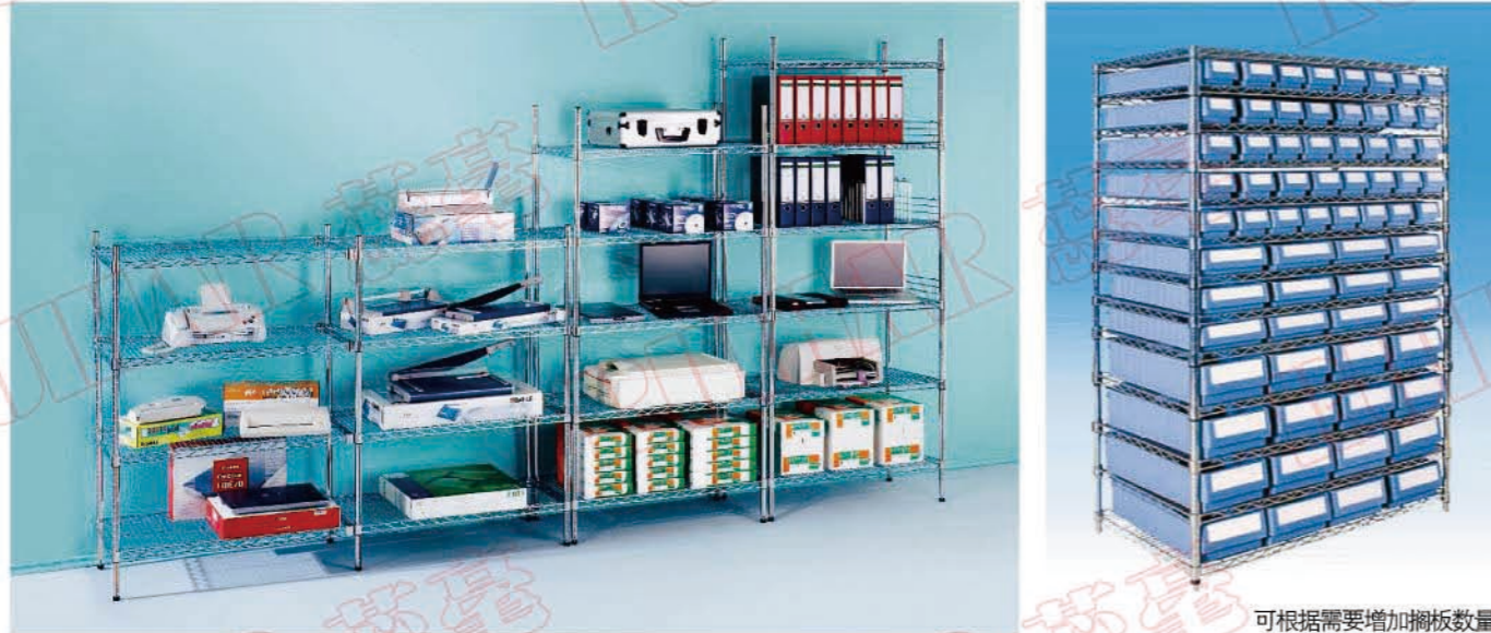
可根据需要增加搁板数量

采用碳钢镀铬网片及支柱组合而成，其独特的造型结构，设计灵巧，装卸简便，洁净亮丽，坚固的碳钢镀铬网片能促进空气流通，减少尘埃积聚，开放式的设计，令储物一眼可见。